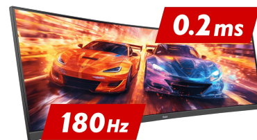
180Hz & 0.2ms MPRT

De Fast IPS-paneeltechnologie garandeert niet alleen betrouwbaarheid, levendige slagveldscènes die worden weergegeven met een voortreffelijke kleurnauwkeurigheid, maar biedt ook een uitstekende Moving Picture Response Time (MPRT) van 0.2ms.