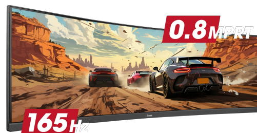
165Hz & 0.8ms MPRT

Ultrabrede 32:9 monitoren met een DQHD 5120x1440 resolutie, ook bekend als Dual QHD, garanderen messcherpe beelden die je games tot leven brengen. Deze monitoren stellen je in staat om je gamingopstelling te organiseren voor een ongeëvenaarde game-ervaring. Geen enkel detail zal aan je voorbijgaan!