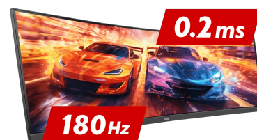
180Hz & 0.2ms MPRT

La dalle Fast IPS garantit non seulement des scènes de champ de bataille vives et de haute fidélité affichées avec une précision de couleur exceptionnelle, mais elle offre également un temps de réponse d'image en mouvement (MPRT) exceptionnel de 0.2 ms.