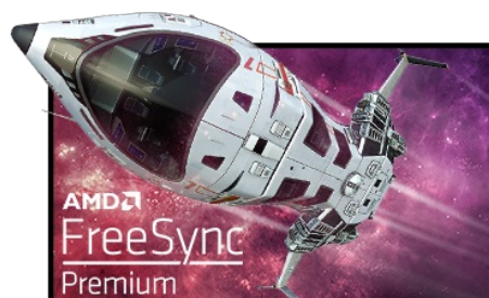
Technologie FreeSync™ Premium

La dalle en technologie Fast IPS à 240 Hz garantit des scènes de champ de bataille vives, haute fidélité d'affichage avec des couleurs exceptionnellement précises et offre un temps de réponse d'image animée (MPRT) époustoufflant de 1 ms.