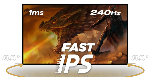
240Hz & 1ms MPRT

La dalle en technologie Fast IPS garantit une superbe qualité d'image, et la possibilité de régler la luminosité et les nuances sombres avec la fonction Black Tuner offre de meilleures performances de visualisation dans les zones ombragées. Pour assurer le confort pendant les sessions de jeu marathon, vous pouvez facilement ajuster la position de l'écran selon vos préférences grâce au support réglable en hauteur.