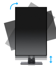
HAS + Pivot

I display IPS sono noti soprattutto per gli ampi angoli di visione e i colori naturali e precisi. Sono particolarmente adatti per applicazioni critiche dal punto di vista del colore.