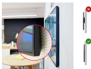
Zero-Gap Wall Mount

LH6570UHB разработан для непрерывной круглосуточной работы, поэтому его можно устанавливать и использовать как в альбомной, так и в портретной ориентации. Впечатляющая и наименьшая в своем классе глубина корпуса 35мм (при использовании прилагаемых проприетарных кронштейнов) означает, что этот дисплей можно установить незаметно и элегантно в любом месте.