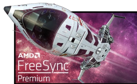
FreeSync™ Premium Technologie

UHD resolutie (3840x2160), beter bekend als 4K, biedt een gigantische kijkveld met 4 keer meer informatie en werkruimte dan een Full HD-scherm. De hoge DPI (dots per inch)garandeert een ongelooflijk scherp en helderbeeld.