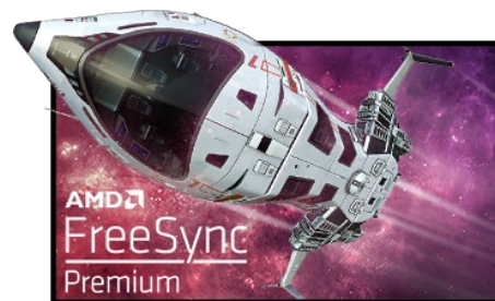
Technologie FreeSync™ Premium

La Résolution UHD (3840 x 2160), plus connu sous la dénomination 4K, vous offre une zone d'affichage gigantesque avec 4 fois plus d'espace d'information et de travail qu'un écran classique en Full HD. En raison de sa haute densité de points par pouce (DPI), il affichera des images incroyablement fines et pointues.