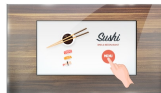
Тач через стекло

IPS displays are best known for wide viewing angles and natural, highly accurate colours. They are especially suited for colour-critical applications.