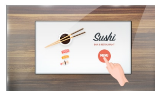
Touch durch Glas

Die IPS-Displays sind vor allem für weite Betrachtungswinkel und natürliche, hochgenaue Farben bekannt. Sie eignen sich besonders für farbkritische Anwendungen.