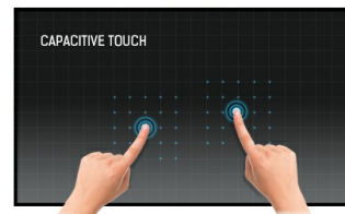
Dotyková technologie – kapacitní

IPS displays are best known for wide viewing angles and natural, highly accurate colours. They are especially suited for colour-critical applications.