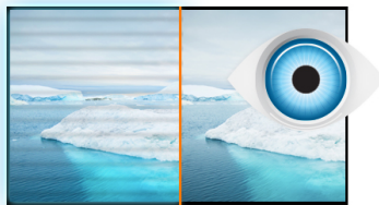
Flicker free + Blue light

Il ProLite B2483HSU è un eccellente Monitor Full HD da 24", retroilluminato a LED, con una risoluzione 1920 x 1080p. Caratterizzato da un tempo di risposta da 1 ms e un rapporto di contrasto avanzato di 80 000 000 : 1, assicura così una qualità dell'immagine chiara e vibrante, con un contrasto elevato. Un supporto triplo di connessione, garantisce la compatibilità di installazione con le più recenti schede grafiche e Notebook. Il supporto ergonomico dello schermo offre una regolazione in altezza di 13 cm. Un perno girevole e inclinabile, rende questo schermo adatto ad una vasta gamma di applicazioni e ambienti, in cui la flessibilità e l'ergonomia sul posto di lavoro, sono fattori chiave. Inoltre il monitor ha una certificazione TCO e Energy Star. Una soluzione perfetta per l'istruzione educativi, uffici, imprese e i mercati finanziari.