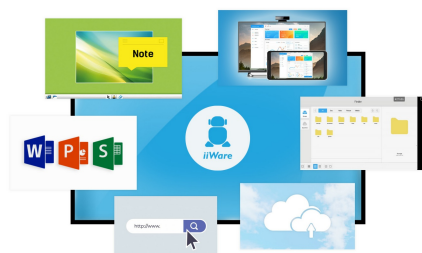
iiWare 8.0 (Android OS)

Delite, strimujte i uređujte sadržaj sa bilo kojeg uređaja direktno na ekranu i pretvarajte sastanke ili predavanja svog tima u laganu, brzu i neometanu interaktivnu sesiju sa uključenim WiFi modulom ( OWM001 ) i aplikacijom ScreenSharePro.