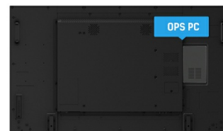
OPS PC SLOT

Les écrans IPS sont surtout connus pour leurs larges angles de vision et leurs couleurs naturelles très précises. Ils sont particulièrement adaptés aux applications à couleur critique.