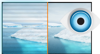
Flicker free + Blue light

Het langdurig kijken naar een beeldscherm kan vermoeidheid van de ogen veroorzaken. Maar dat hoeft niet! De nieuwe 27" iiyama ProLite B2791HSU is groot genoeg om ervoor te zorgen dat u elk detail duidelijk kunt zien. De achtergrondverlichting van het paneel is flikkervrij en de blauwe lichtvermindering funktie beperkt de hoeveelheid blauw, het meest hinderlijke licht, dat door het scherm wordt uitgezonden. Met de in hoogte verstelbare voet kunt u de schermstand gemakkelijk naar uw voorkeur aanpassen. VGA-, HDMI-, en DisplayPort- ingangen zorgen samen met de USB-HUB voor een breed scala aan aansluitmogelijkheden. En omdat deze monitor met slechts 1ms reactietijd en FreeSync ondersteuning is uitgerust, kan dit scherm naast kantoordoeleinden ook prima gebruikt worden voor het (af)spelen van games en video's. Ook verkrijgbaar in zwart: ProLite B2791HSU-B1 .