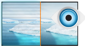
Flicker free + Blue light

Het langdurig kijken naar een beeldscherm kan vermoeidheid van de ogen veroorzaken. Maar dat hoeft niet! De nieuwe 27" iiyama ProLite B2791HSU is groot genoeg om ervoor te zorgen dat u elk detail duidelijk kunt zien. De achtergrondverlichting van het paneel is flikkervrij en de blauwe lichtvermindering funktie beperkt de hoeveelheid blauw, het meest hinderlijke licht, dat door het scherm wordt uitgezonden. Met de in hoogte verstelbare voet kunt u de schermstand gemakkelijk naar uw voorkeur aanpassen. VGA-, HDMI-, en DisplayPort- ingangen zorgen samen met de USB-HUB voor een breed scala aan aansluitmogelijkheden. En omdat deze monitor met slechts 1ms reactietijd en FreeSync ondersteuning is uitgerust, kan dit scherm naast kantoordoeleinden ook prima gebruikt worden voor het (af)spelen van games en video's. Ook verkrijgbaar in zwart: ProLite B2791HSU-B1 .