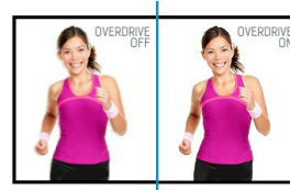
OverDrive ON / OFF

Controlling the monitor's brightness through electric current has allowed us to eliminate the screen flicker. You can easily test it yourself – just look at the screen via you smartphone's camera. Your eyes will love it.