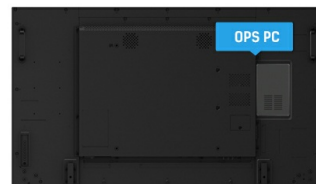
OPS PC SLOT

IPS-schermen staan vooral bekend om hun brede kijkhoeken en natuurlijke, zeer nauwkeurige kleuren. Ze zijn bijzonder geschikt voor kleurkritische toepassingen.