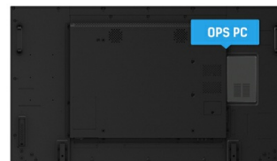
OPS PC SLOT

I display IPS sono noti soprattutto per gli ampi angoli di visione e i colori naturali e precisi. Sono particolarmente adatti per applicazioni critiche dal punto di vista del colore.