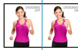
OverDrive ON / OFF

Stopka z regulacją wysokości umożliwia dostosowanie położenia ekranu do własnych preferencji. Rotacja ekranu umożliwia zmianę pozycji ekranu z poziomej (pejzaż) do pionowej (portret). To funkcja szczególnie przydatna w pracy z długimi arkuszami lub tekstem.