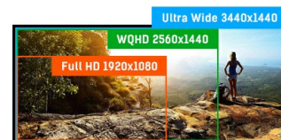
ULTRA WIDE - UWQHD

Matryce IPS są doceniane ze względu na szerokie kąty widzenia i dokładne, naturalne odwzorowanie kolorów. Sprawdzą się szczególnie tam, gdzie najważniejszą rolę odgrywają kolory.