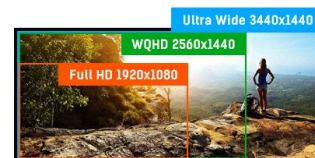
ULTRA WIDE - UWQHD

Les écrans IPS sont surtout connus pour leurs larges angles de vision et leurs couleurs naturelles très précises. Ils sont particulièrement adaptés aux applications à couleur critique.