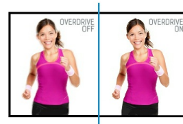
OverDrive ON / OFF

Die IPS-Displays sind vor allem für weite Betrachtungswinkel und natürliche, hochgenaue Farben bekannt. Sie eignen sich besonders für farbkritische Anwendungen.