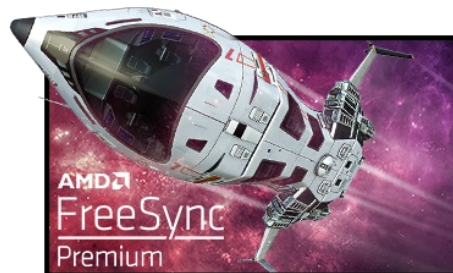
Tecnología FreeSync™ Premium

Inspirada en la curva del ojo humano, la curvatura 1500R de la pantalla garantiza una experiencia de visualización realista y cómoda que te permite sumergirte realmente en el juego.