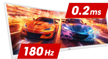
180Hz & 0.2ms MPRT

Die Fast IPS Technologie garantiert nicht nur lebendige Schlachtfeldszenen mit hoher Farbtreue, sondern auch eine ultraschnelle Reaktionszeit von nur 0.2ms (MPRT) für bewegte Bilder.