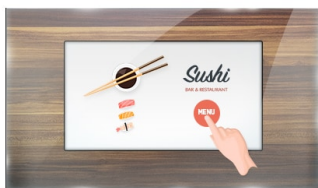
Тач через стекло

Монитор ProLite TF1015MC (10.1 дюйма) использует сенсорную технологию PCAP и выполнен в привлекательной рамке со стеклом от края до края. Благодаря стеклянной накладке, покрывающей экран, и прочной рамке, он гарантирует высокую прочность и устойчивость к царапинам, что делает его идеальным для киосков и общественных мест с высокой интенсивностью использования. Технология IPS-панели обеспечивает точную и стабильную цветопередачу с широкими углами обзора. Оснащенный пенопластовым уплотнителем, он обеспечивает бесшовную интеграцию в киоски и имеет класс защиты IP65, что позволяет защитить его от пыли и воды с лицевой стороны. Ландшафтная, портретная и лицевая ориентация обеспечивает гибкие возможности монтажа практически в любом месте. Для удобства интеграции TF1015MC может быть оснащен дополнительными внешними монтажными кронштейнами ( OMK2-1 ), что делает его идеальным решением для интеграторов киосков, промышленных сред, диспетчерских и интерактивных мультимедиа.