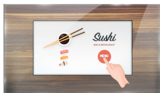
Тач через стекло

Монитор ProLite TF1015MC (10.1 дюйма) использует сенсорную технологию PCAP и выполнен в привлекательной рамке со стеклом от края до края. Благодаря стеклянной накладке, покрывающей экран, и прочной рамке, он гарантирует высокую прочность и устойчивость к царапинам, что делает его идеальным для киосков и общественных мест с высокой интенсивностью использования. Технология IPS-панели обеспечивает точную и стабильную цветопередачу с широкими углами обзора. Оснащенный пенопластовым уплотнителем, он обеспечивает бесшовную интеграцию в киоски и имеет класс защиты IP65, что позволяет защитить его от пыли и воды с лицевой стороны. Ландшафтная, портретная и лицевая ориентация обеспечивает гибкие возможности монтажа практически в любом месте. Для удобства интеграции TF1015MC может быть оснащен дополнительными внешними монтажными кронштейнами ( OMK2-1 ), что делает его идеальным решением для интеграторов киосков, промышленных сред, диспетчерских и интерактивных мультимедиа.