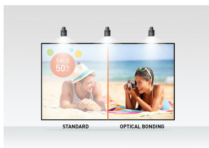
Optical bonded PCAP

Ook verkrijgbaar in het zwart : ProLite T2752MSC-B1