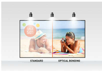
Optical bonded PCAP

Disponible aussi en blanc : ProLite T2752MSC-W1