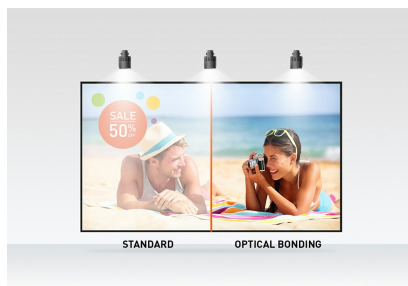
Optical bonded PCAP

Le ProLite T2755MSC avec la résolution Full HD (1920x1080) et la dalle IPS offre des couleurs exceptionnelles et de larges angles de vision. La technologie tactile PCAP (Optical Bonded Projective Capacitive) à 10 points garantit une réponse tactile transparente et précise, ainsi qu'une réflexion lumineuse réduite. Un revêtement nanométrique spécial assure un toucher plus doux et moins de résistance lors du balayage. Il rend l'écran moins statique et moins sensible à la saleté, à la poussière et aux empreintes digitales. Un choix parfait pour un large éventail d'applications.