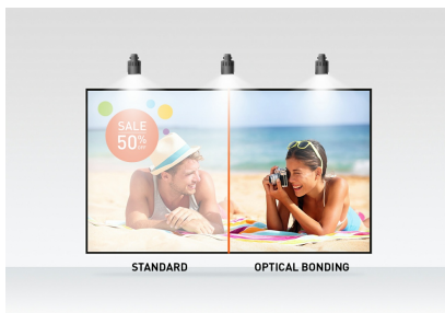
Optical bonded PCAP

Met de Optical Bonded Projective Capacitive (PCAP) 10 punts Touch-technologie levert de ProLite TF2238MSC-B1 een naadloze en accurate Touch ervaring. Deze Full HD (1920x1080) Open Frame monitor met IPS-paneeltechnologie garandeert een uitzonderlijke kleurechtheid en hoog contrast vanuit elke kijkhoek. Een robuuste metalen behuizing en krasbestendig 7H edge-to-edge glas met anti-vingerafdruk coating maken de monitor bijzonder geschikt voor integratie in veeleisende omgevingen. Bovendien voldoet de monitor aan een IPX1 beschermingswaardering, waardoor hij waterdicht is voor gedurende tijd tegen druppelend water en is de display beschermd tegen vochtigheid en mogelijke vochtontwikkeling. De ProLite TF2238MSC-B1 kan worden gebruikt in landscape, portrait and face-up oriëntatie. Een perfecte oplossing voor kiosksystemen, detailhandel en interactieve digitale signage installaties.