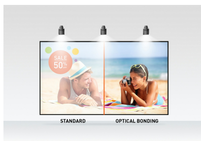
Optical bonded PCAP

El monitor de marco abierto Full HD (1920x1080) ProLite TF2238MSC-B1 con tecnología de panel IPS ofrece colores excepcionales y amplios ángulos de visión. La tecnología táctil capacitiva proyectada (PCAP) de 10 puntos con enlace óptico garantiza una respuesta táctil fluida y precisa, y una menor reflexión de la luz; además, la pantalla está protegida contra la humedad y el desarrollo potencial de humedad. Una resistente carcasa de metal y un cristal resistente a los arañazos de borde a borde de 7H con revestimiento antihuellas hacen que el monitor sea especialmente adecuado para la integración en entornos exigentes. El monitor también cumple con la clasificación de protección IPX1, lo que lo hace resistente al agua durante un período de tiempo contra salpicaduras. El ProLite TF2238MSC-B1 se puede usar en orientación horizontal, vertical y hacia arriba. Una solución perfecta para sistemas de quioscos, venta al por menor e instalaciones de señalización digital interactiva.