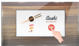
Tocco attraverso vetro

Il ProLite T2234MSC-B1S utilizza la tecnologia touch capacitiva proiettiva a 10 pt, integrata in una cornice accattivante con vetro edge-to-edge. Dotato di tecnologia IPS, offre un'eccezionale resa cromatica e ampi angoli di visione, che lo rendono un display perfetto per il Digital Signage interattivo, gli integratori di chioschi, l'Instore Retail, i giochi e le presentazioni interattive. Oltre alla superba qualità dell'immagine, il monitor è dotato di grado di protezione IP65, che lo rende resistente alla polvere e all'acqua, e di tecnologia Touch-Through-Glass, che garantisce una risposta tattile precisa e senza interruzioni per una vera integrazione nei chioschi o nel retail dietro i vetri.