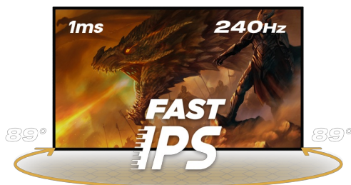
240Hz & 1ms MPRT

Die Fast IPS Panel Technologie garantiert dir eine hervorragende Bildqualität, die Black Tuner Technologie lässt dich selbst kleinste Details in schwach ausgeleuchteten Spielumgebungen erkennen, sodass nichts deiner Aufmerksamkeit entgeht. Dank des höhenverstellbaren Standfusses kannst Du die Bildschirmposition ganz einfach an deine Vorlieben anpassen, um Dir einen guten Komfort während deiner Gaming-Session zu gewährleisten.