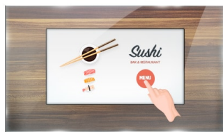
Dotkněte se skla

ProLite ProLite TF1615MC-B1 (39.5 cm) používá PCAP dotykovou technologii a je zabudován do okuláru s bez rámečkovým šasi. Díky skleněné vrstvě kryjící obrazovku a robustnímu rámu zaručuje vysokou odolnost a odolnost proti poškrábání, takže je ideální pro kiosky a místa veřejného prostoru. Vybavená pěnovým těsněním, podporuje bezproblémovou montáž do kiosků a zajišťuje stupeň krytí IP65, což vede k odolnosti proti prachu a vodě v přední části obrazovky. Orientace na šířku, na výšku i lícovou stranou zajišťuje flexibilní možnosti montáže téměř v jakékoli instalaci. Pro snadnou montáž a umístění je přístroj ProLite TF1615MC-B1 vybaven externími montážními držáky ( OMK5-1 ), což je ideální řešení pro integrátory kiosku, průmyslové prostředí, řídicí místnosti a interaktivní multimédia.